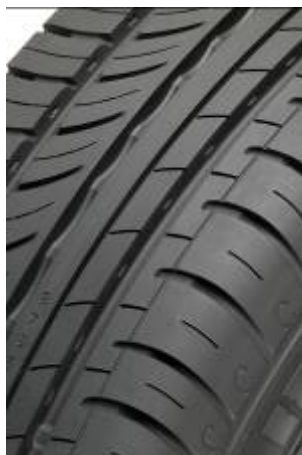
Vågstöd på mittytan